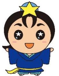
枚方市 ひこぼしくん